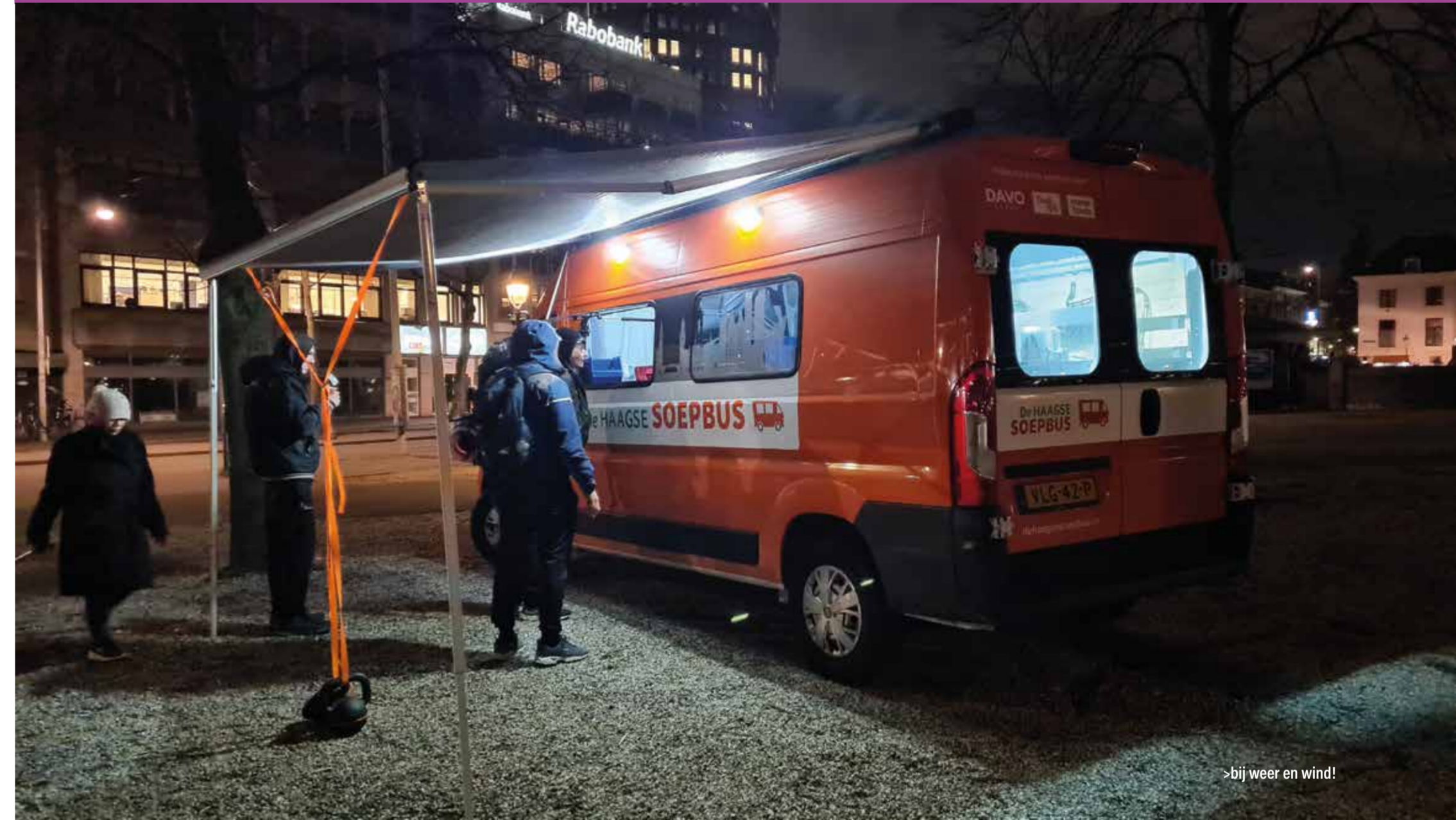
>bij weer en wind!